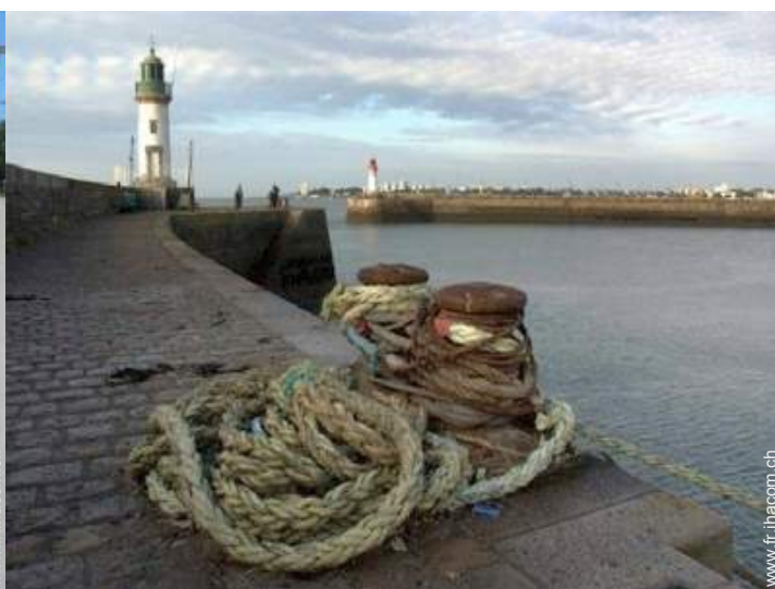
port de plaisance