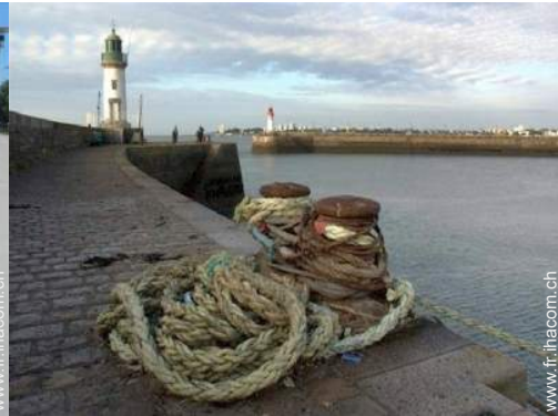
port de plaisance