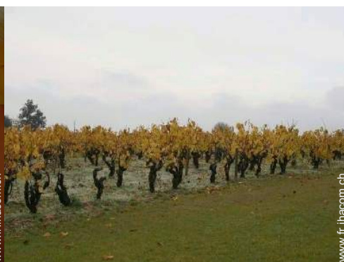
vue sur vignobles