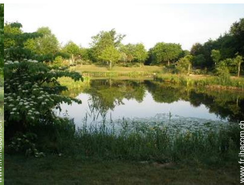
vue sur lac