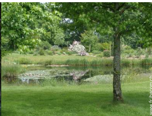
vue sur lac