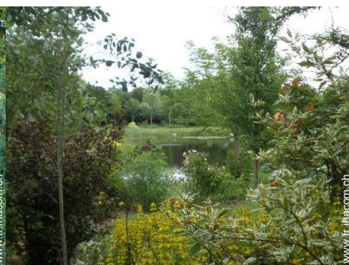
vue sur lac