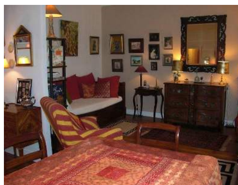
lit(s) escamotable(s) 2 pers