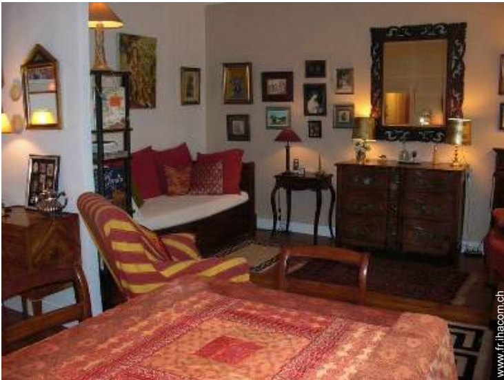
lit(s) escamotable(s) 2 pers