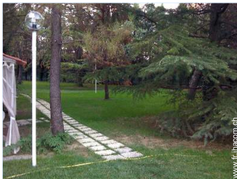
vue depuis le patio