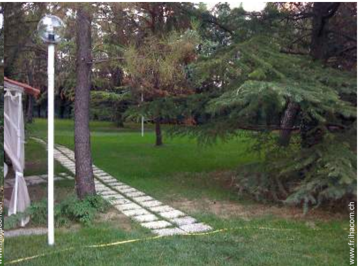
vue depuis le patio