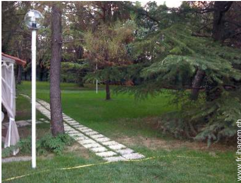
vue depuis le patio