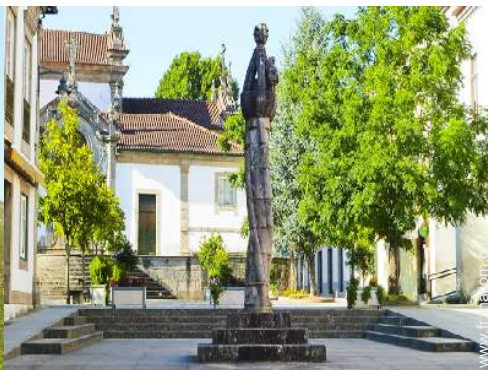
Attraites et détente