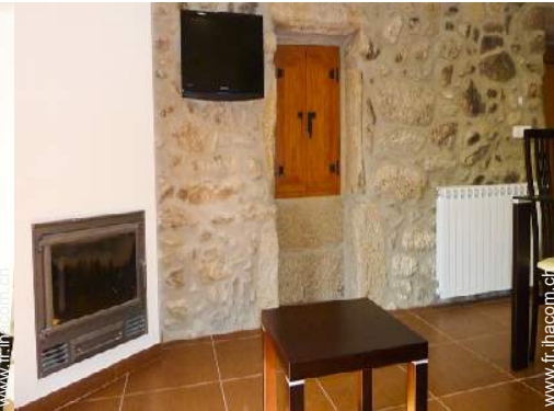
poêle à bois