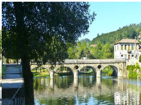
Attraites et détente