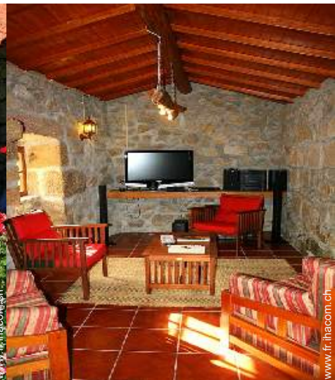
salon de musique