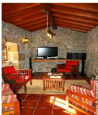
salon de musique