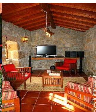
salon de musique