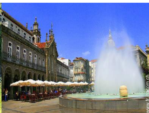
Villes à proximité