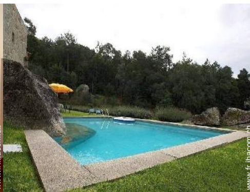
vue sur forêt