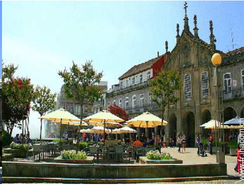
vue sur centre ville