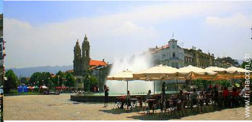
vue sur centre ville