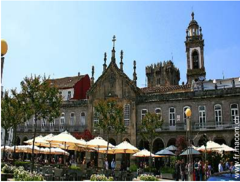
vue sur ville