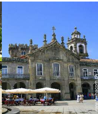
vue sur centre ville