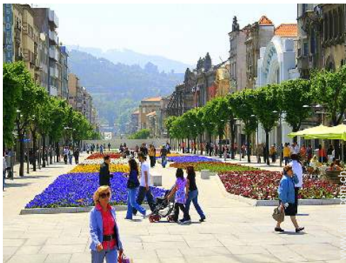
vue sur centre ville