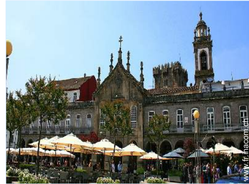
vue sur ville