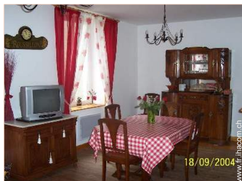
vue depuis la salle à manger