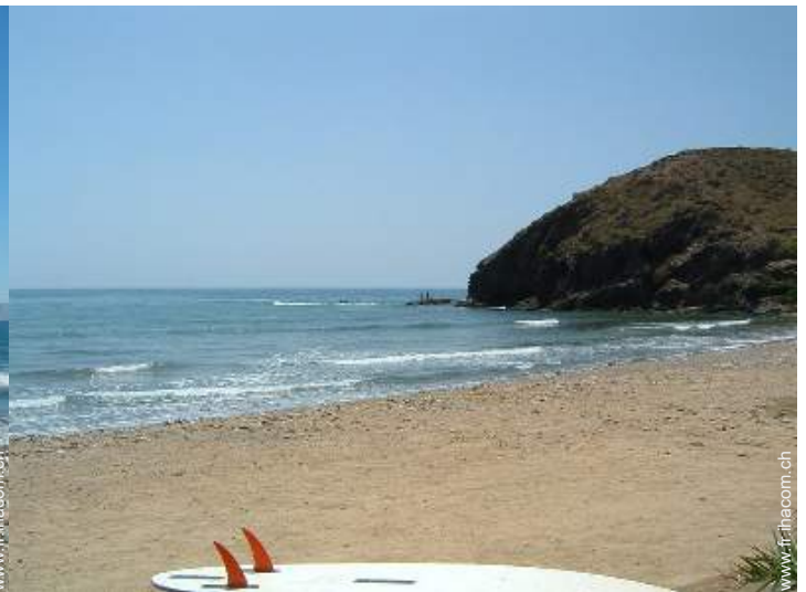
vue sur océan