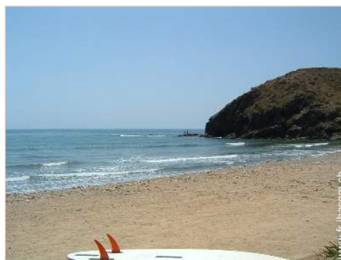
vue sur océan