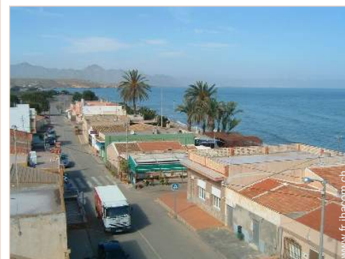
Maison de Pêcheur de Charme