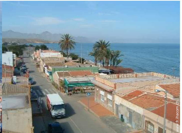
Maison de Pêcheur de Charme