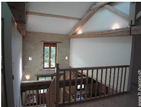
vue depuis la mezzanine