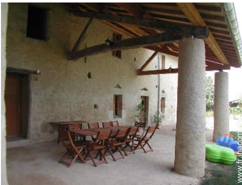
table(s) de jardin