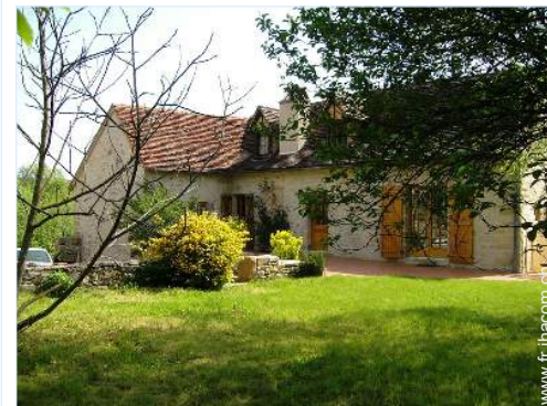
Maison en Pierre