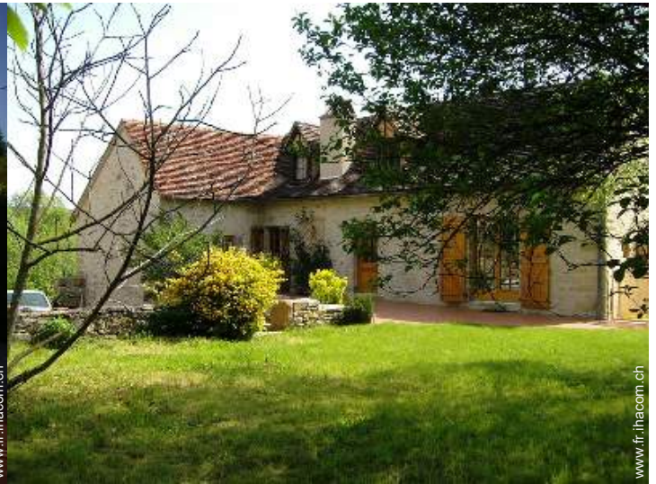
Maison en Pierre