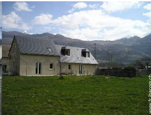
vue sur prairie