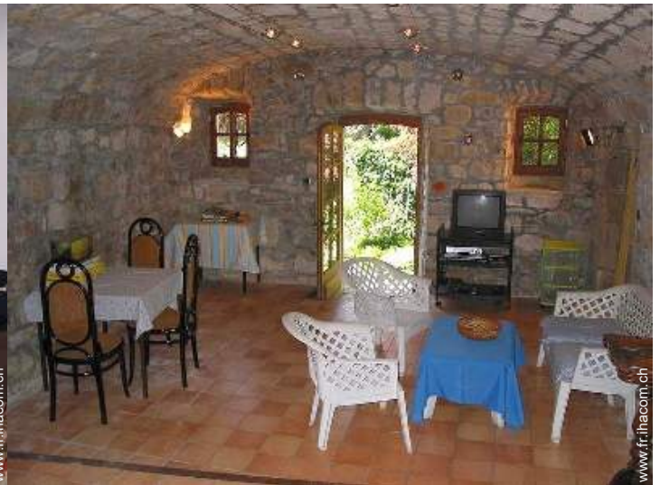
salle de jeux