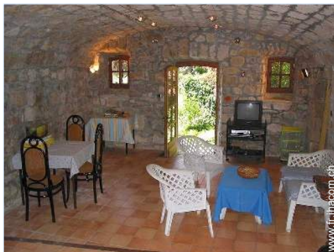
salle de jeux