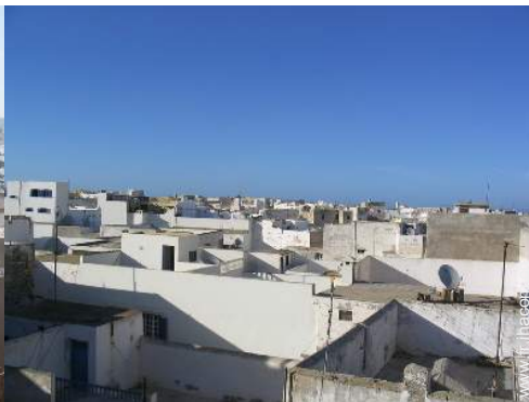
vue sur les toits