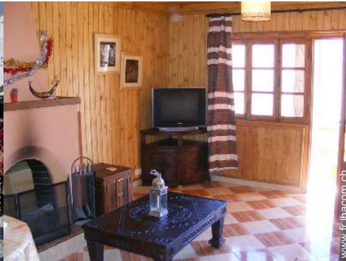
Chalet de Montagne de Prestige