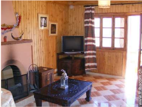
Chalet de Montagne de Prestige