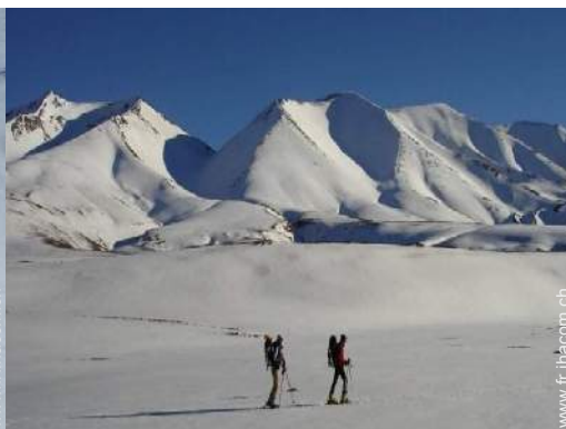
ski de fond