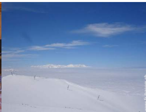
pistes de ski