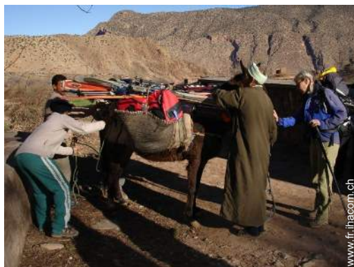
ski de randonnée