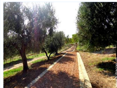
parc et jardin