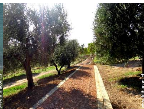
parc et jardin