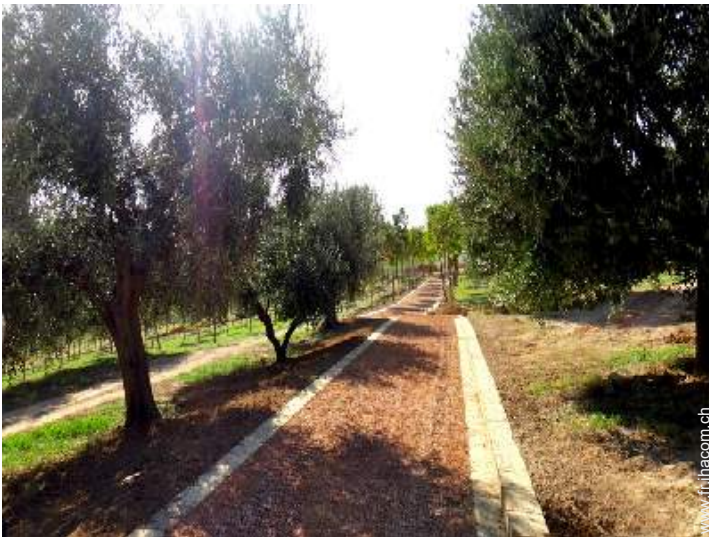
parc et jardin