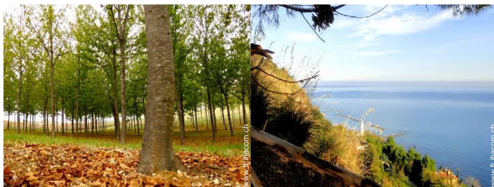
parc et jardin