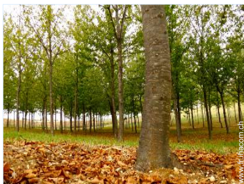
parc et jardin