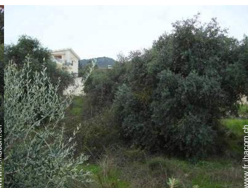
vue sur montagne