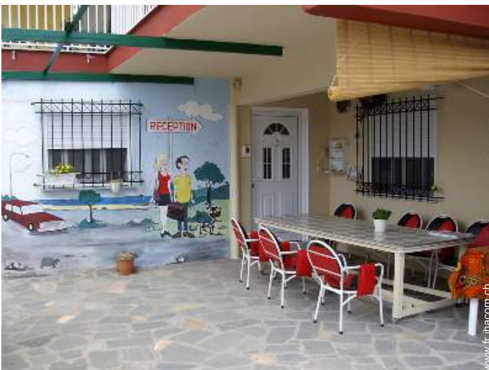
chambre du propriétaire