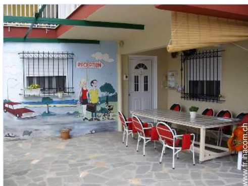
chambre du propriétaire