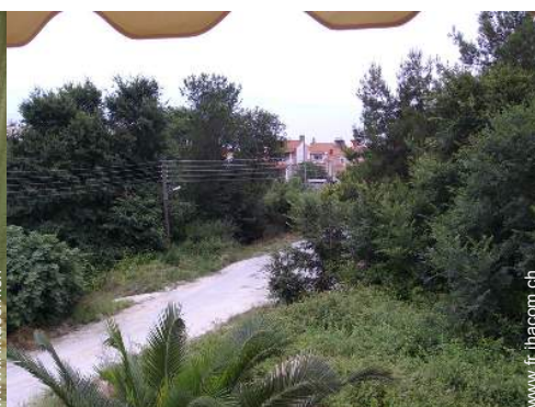
vue sur campagne