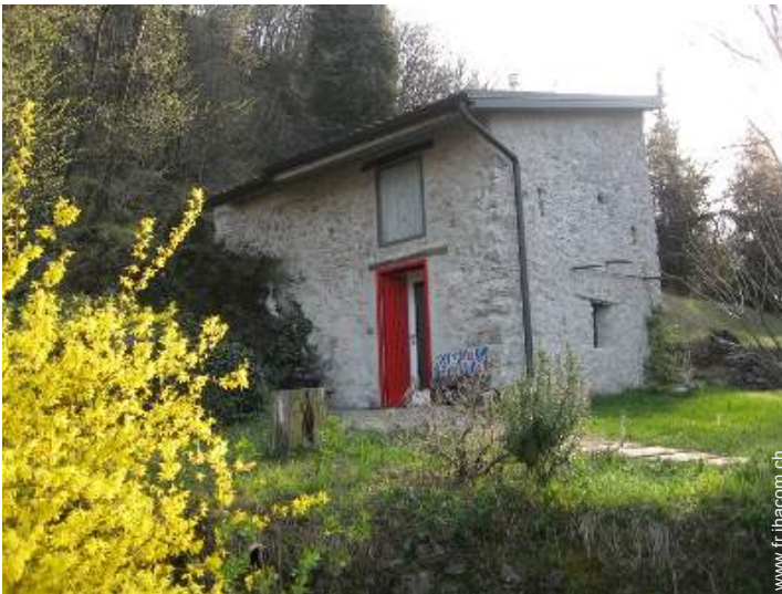
Maison en Pierre