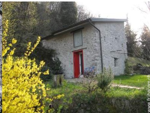
Maison en Pierre