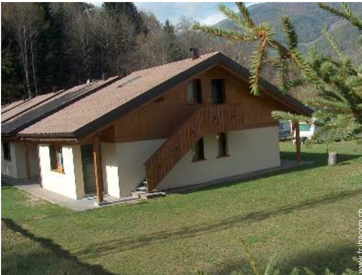
Chalet de Montagne