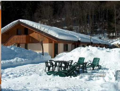
chaise(s) de jardin