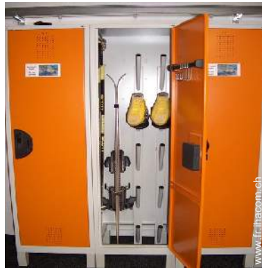
local à ski