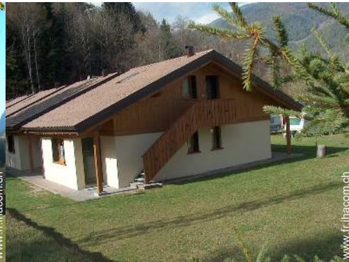
Chalet de Montagne