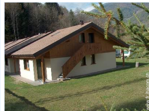
Chalet de Montagne