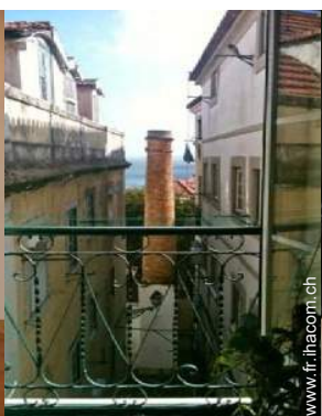
vue sur rivière