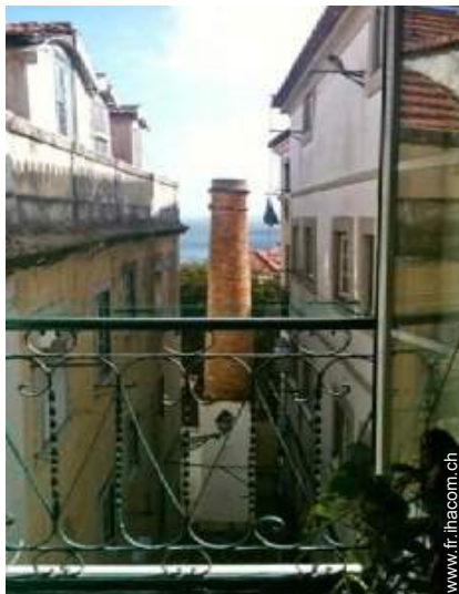
vue sur rivière