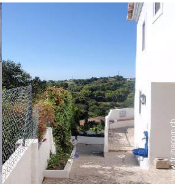
vue depuis le patio