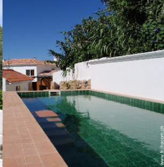
Equipements extérieurs à disposition des hôtes