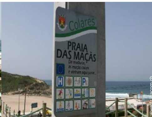
loisirs balnéaires à proximité