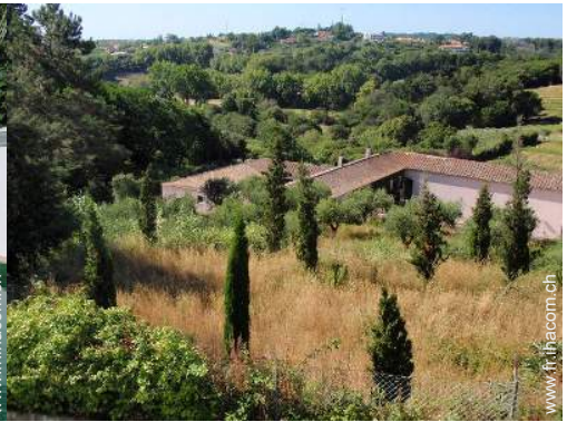
Equipements extérieurs à disposition des hôtes