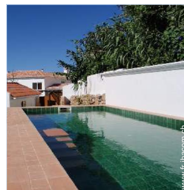
Equipements extérieurs à disposition des hôtes