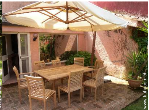
table(s) de jardin