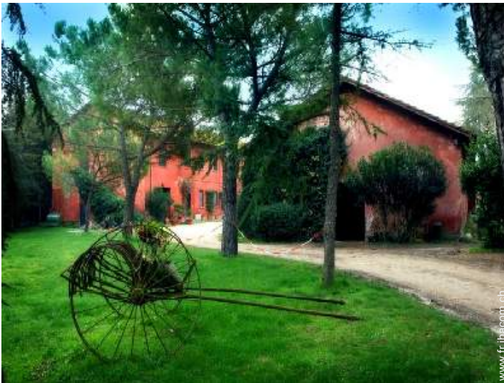
Ancienne Ferme de Charme