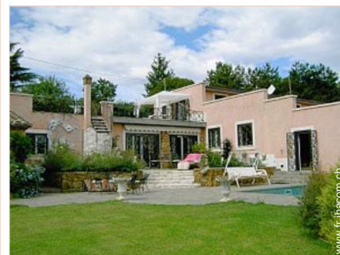
Propriété de Prestige