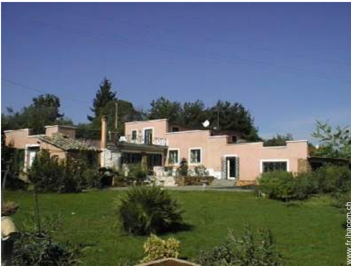
Villa de Charme