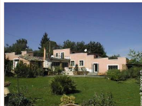
Villa de Charme