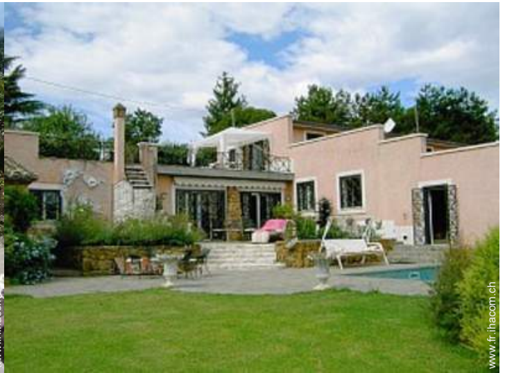
Propriété de Prestige