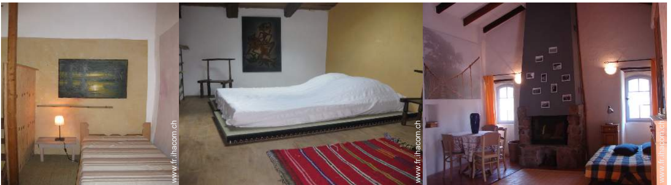
lit(s) futon 2 pers