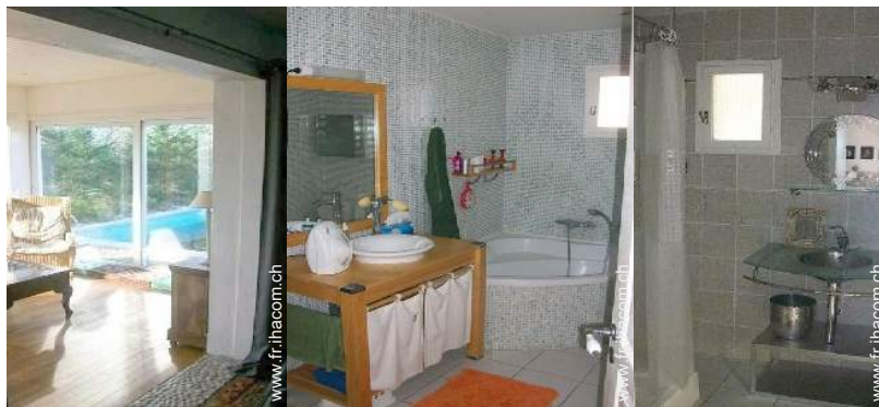
vue depuis la véranda