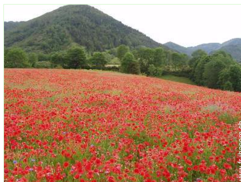
vue depuis le patio