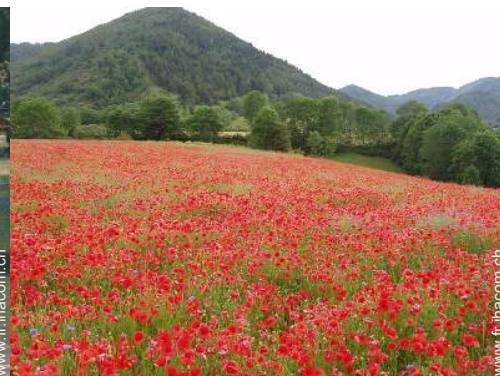
vue depuis le patio