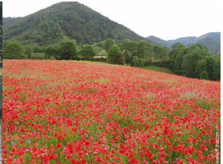
vue depuis le patio