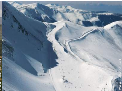
pistes de ski