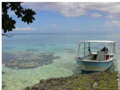
bateau à moteur