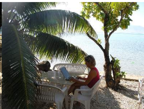
wifi (accès internet sans fil)