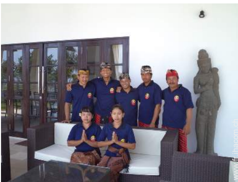
personnel de maison