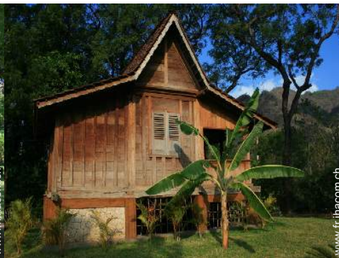
possibilité couchage(s) supplémentaire(s)