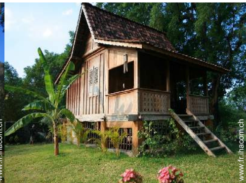
possibilité couchage(s) supplémentaire(s)