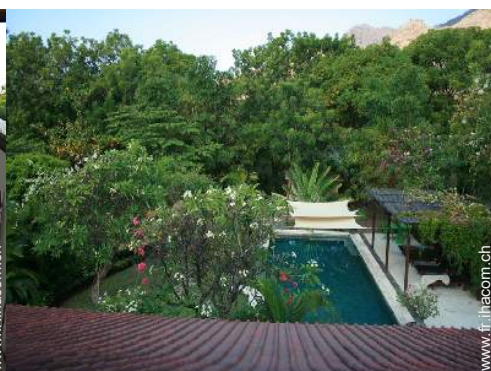
vue depuis la terrasse sur toit