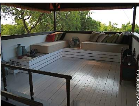
terrasse sur toit