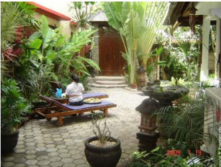
vue sur cour