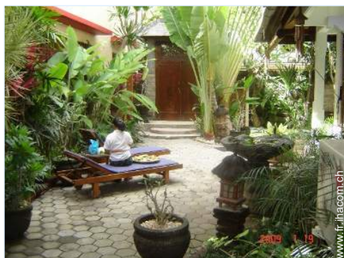
vue sur cour