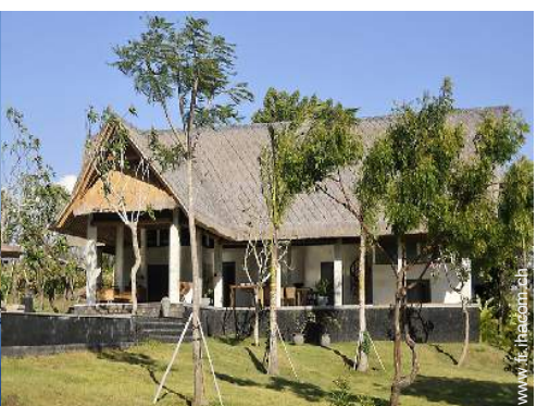
Villa de Prestige