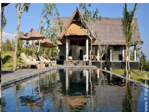
Villa de Prestige