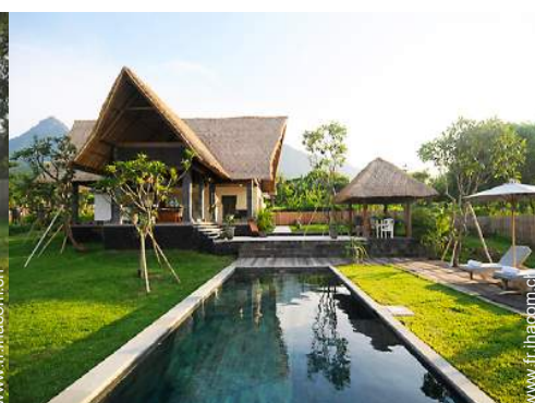
Villa de Prestige