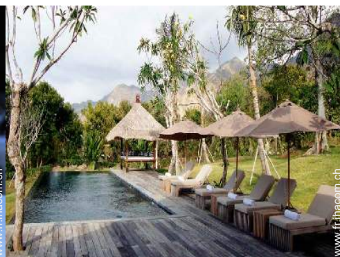
Piscine à débordement