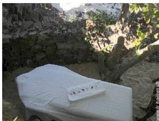
table de massage