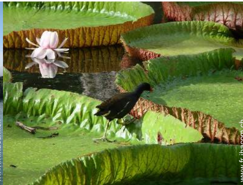
loisirs de montagne à proximité