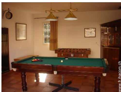
salle de jeux