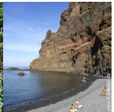
plage de galets