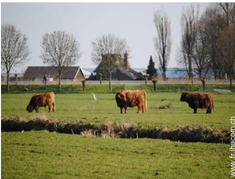
vue sur prairie