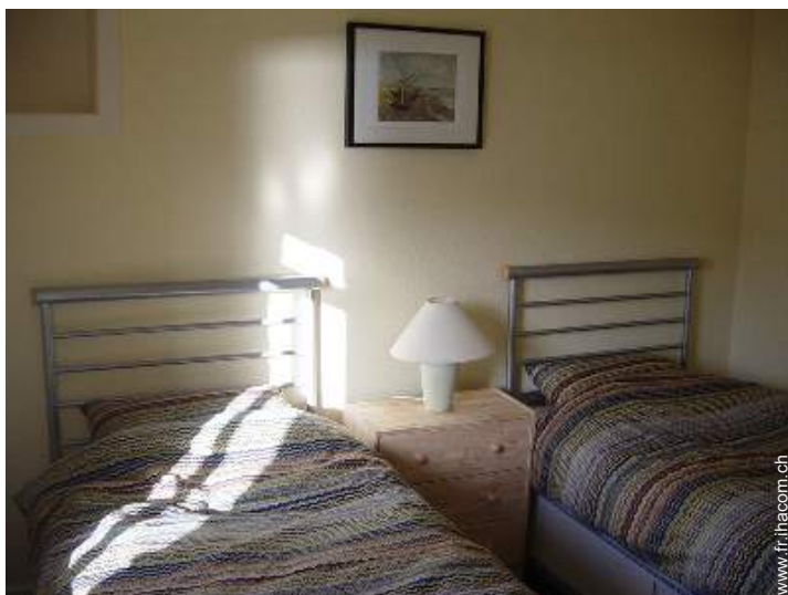
lits jumeaux simple