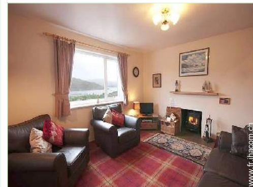
Confort intérieur à disposition des hôtes