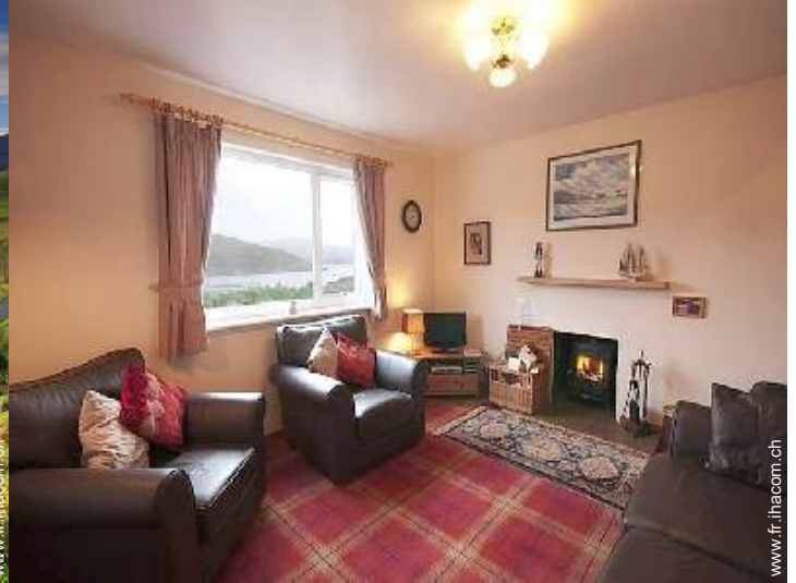
Confort intérieur à disposition des hôtes