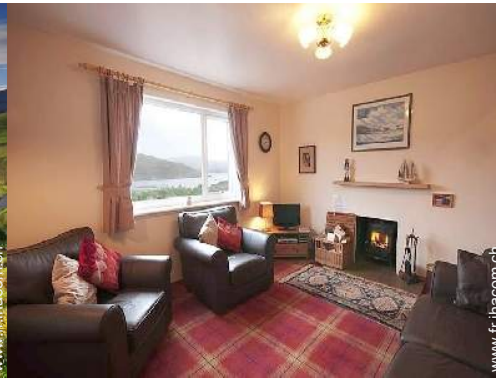
Confort intérieur à disposition des hôtes