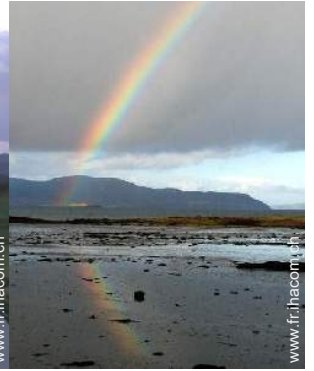
plage de rocher