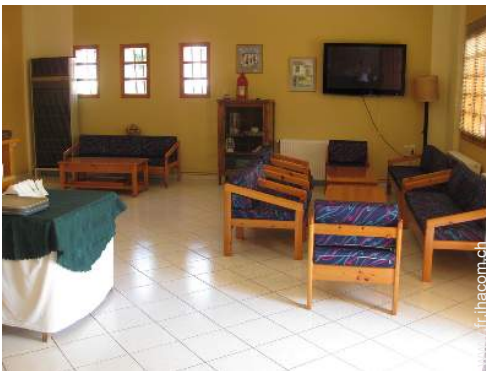
wifi (accès internet sans fil)