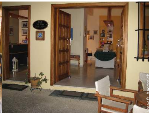
wifi (accès internet sans fil)