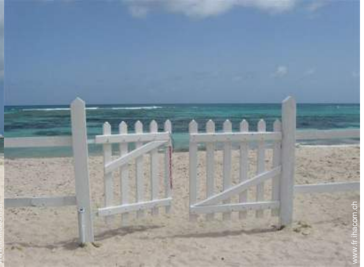
accès direct plage