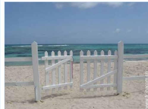
accès direct plage