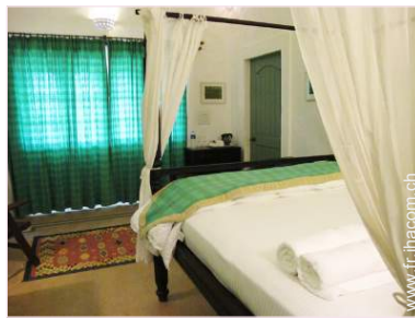
Couchage - lit(s)