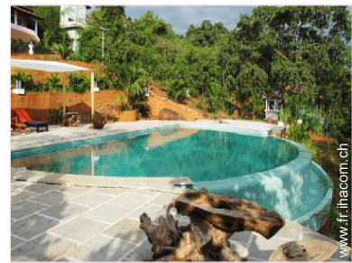
Cadre extérieur à disposition des hôtes