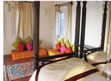
Couchage - lit(s)