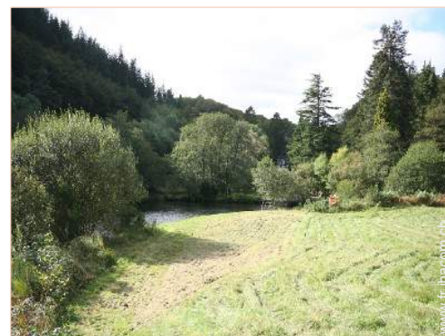
vue sur rivière