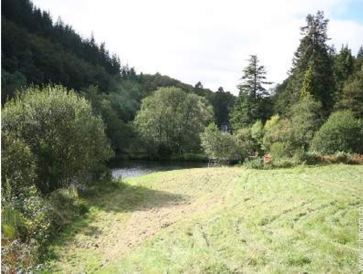
vue sur rivière