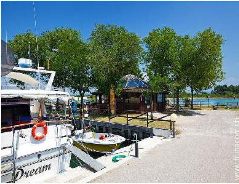
place de bateau au port