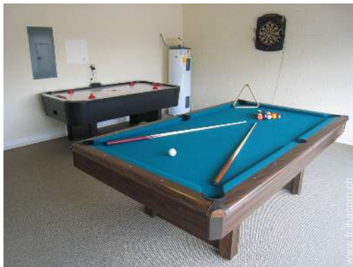
table de billard