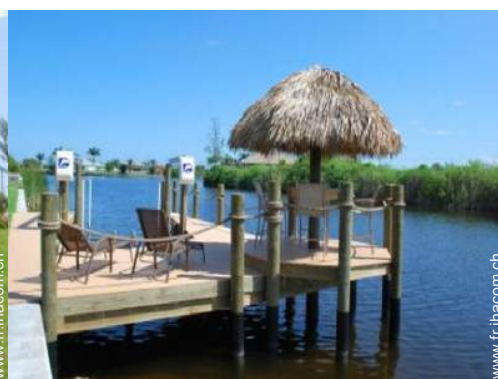
vue sur rivière