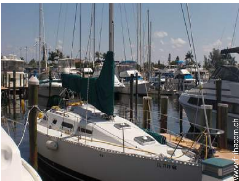
port de plaisance