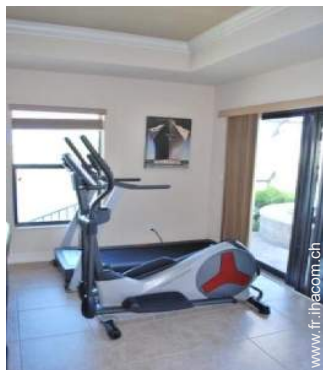
machine(s) de musculation