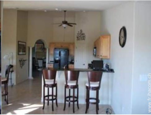
grande cuisine américaine