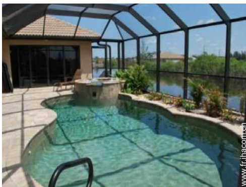
vue depuis le patio