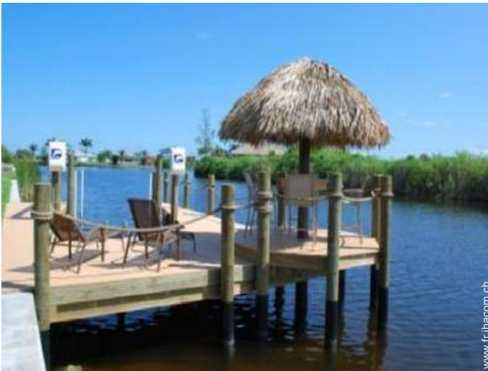
vue sur rivière