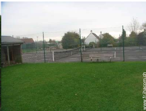
Tennis - surface dure