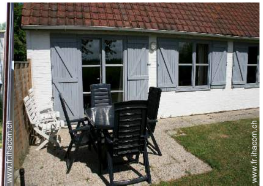
table(s) de jardin