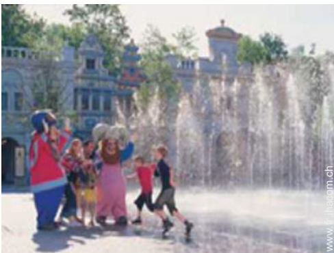
parc de loisirs