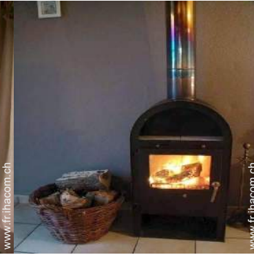
poêle à bois